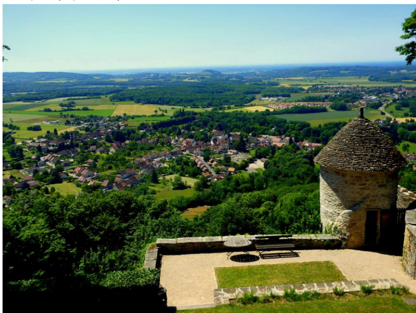
Vue du jardin (Angéline Gazé)

Vous avez également accès à la terrasse et au jardin, desquels vous aurez une vue exceptionnelle sur le vignoble et l'entrée des reculées de Baume-les-Messieurs. Vous pouvez y consommer des boissons chaudes, des limonades artisanales et du juracola.