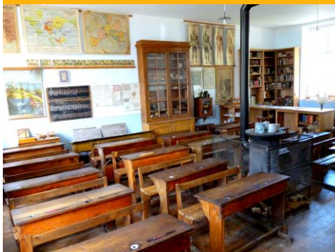
L'école d'autrefois (Angéline Gazé) »