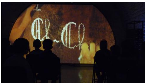
Film « Mystère du vin jaune »